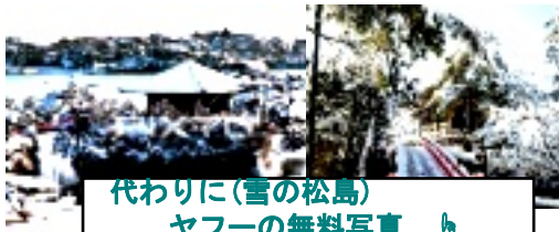
代わりに(雪の松島) ヤフーの無料写真

あけましておめでとう おめでとうございます 令和4年の元旦を雪の中で迎えました。 松島の積雪5cm位でしょうか。 雪かきをしながらの隣人たちとの年賀のあいさつでした。 あまりにも寒いので、雪の松島を写真に撮る気分にならず、