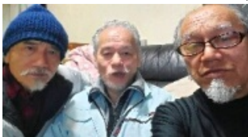
次兄 私 長兄

古希を迎えた三人兄弟が下馬の我が家に数年振りに集い昔話や身体に欠陥が有りながら爺三人、よくまだ働いてる話など楽しく話しました。ひよひよと欠けることなく三兄弟が現役で元気に働いてる奇跡に泣けてきました。