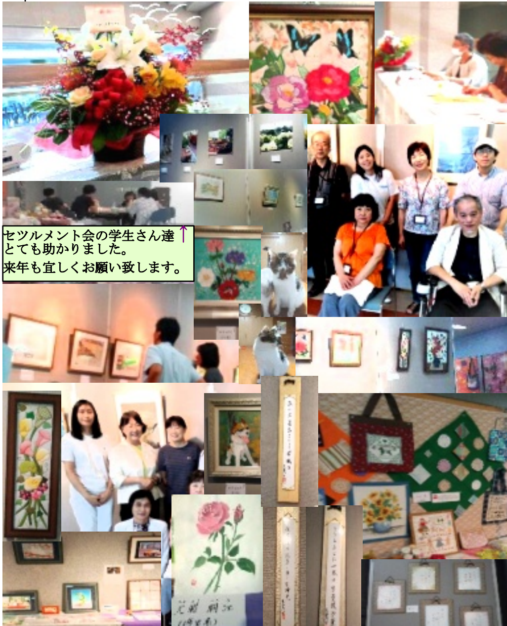
セツルメント会の学生さん達 ↑ とても助かりました。 来年も宜しくお願い致します。