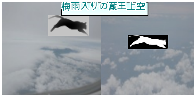
梅雨入りの蔵王上空

機内窓からの蔵王上空と福岡上空。製薬会社の方に搬出を手伝って頂きました、ありがとうございました。